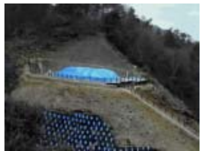
大量の銅鐸が一度に出土 加茂岩倉遺跡