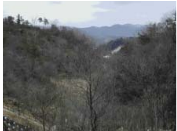
加茂岩倉遺跡からもと来た道 遠方に島根半島を望む