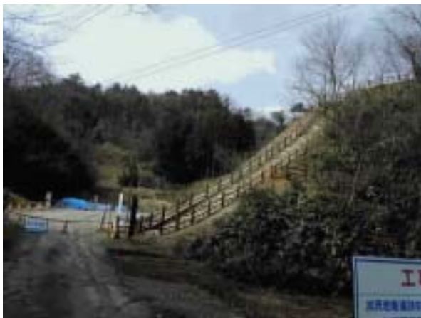
加茂岩倉遺跡入口 右手の丘の上が遺跡

2月12日 朝早く 娘夫婦の案内で米子を出発して国道9号線を松江の方へ。松江の市内を避け玉造から南へ折れて丘陵地を西へ15分ほどで加茂岩倉の郷へ。ちょうど山陰高速道の工事が急てんぽで進んでいる谷合の道路際に岩倉の名の発祥の大岩 岩蔭が見て取れる。街の喧騒の中を脱し、四方丘陵地に囲まれた谷合の静かな場所である。冷たい風が吹きぬけ、朝霧の中「神おわす場所」の感じである。駐車場に車を置いて、谷合の道を10分ほど谷合を入ったところに加茂岩倉があった。今 史跡整備中と見え 足場が幾つも組まれていた。