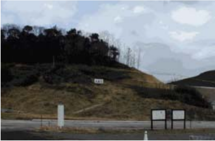
加茂岩倉遺跡のある大岩郷遺跡 正面が大岩〔岩蔭〕岩倉遺跡は反対側

2月12日 朝早く 娘夫婦の案内で米子を出発して国道9号線を松江の方へ。松江の市内を避け玉造から南へ折れて丘陵地を西へ15分ほどで加茂岩倉の郷へ。ちょうど山陰高速道の工事が急てんぽで進んでいる谷合の道路際に岩倉の名の発祥の大岩 岩蔭が見て取れる。街の喧騒の中を脱し、四方丘陵地に囲まれた谷合の静かな場所である。冷たい風が吹きぬけ、朝霧の中「神おわす場所」の感じである。駐車場に車を置いて、谷合の道を10分ほど谷合を入ったところに加茂岩倉があった。今 史跡整備中と見え 足場が幾つも組まれていた。