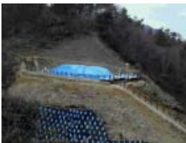
加茂岩倉遺跡への階段

私の知っている銅鐸は神戸の海から見渡せる山々から出土した大型の銅鐸。全く置かれた環境が違ったろう。