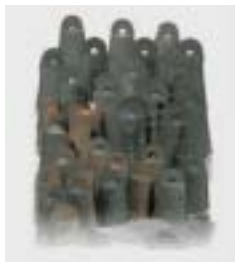
加茂岩倉遺跡出土 大量の銅鐸

また、「なぜこのように大量の青銅器が埋められたのか」そしてその後 この地においても 忽然と青銅器は絶え 日本統一が進む古墳時代へと突入して行く。