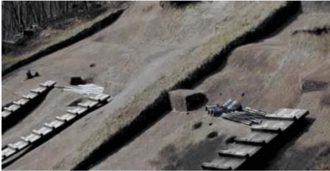
整備された発掘現場 左銅剣 右銅鐸・銅矛（西側）