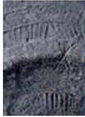
岩倉岩倉遺跡出土の銅鐸にある〔x〕印