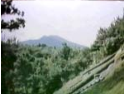
古代出雲 信仰の中心 神名火山〔仏経山〕

古代「iron road 鉄の道」で繰り広げられた壮絶なドラマ 2000年前忽然と消えた大量の銅剣・銅矛・銅鐸がその姿を現わした