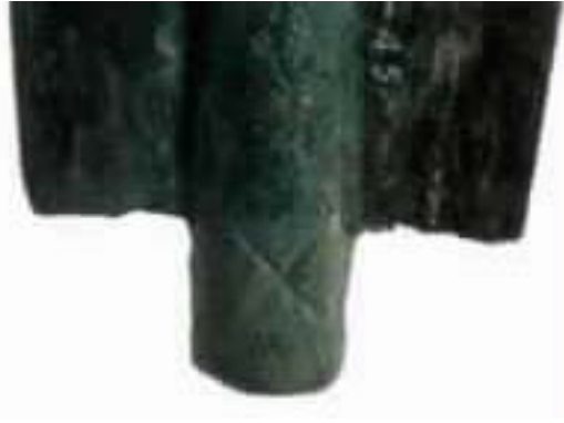
荒神谷遺跡の銅剣の柄に〔x〕印