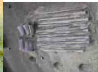
荒神谷遺跡出土 大量の銅剣・銅鐸・銅矛

「この時代 出雲で また 日本各地でなにが起こったのか」この出雲荒神谷・加茂岩倉遺跡の「大量の青銅器出土の謎」については多くの説があるがまだその謎は解けていない。