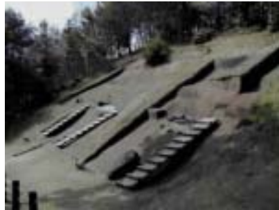
大量の銅剣・銅矛・銅鐸が 埋められていた荒神谷遺跡