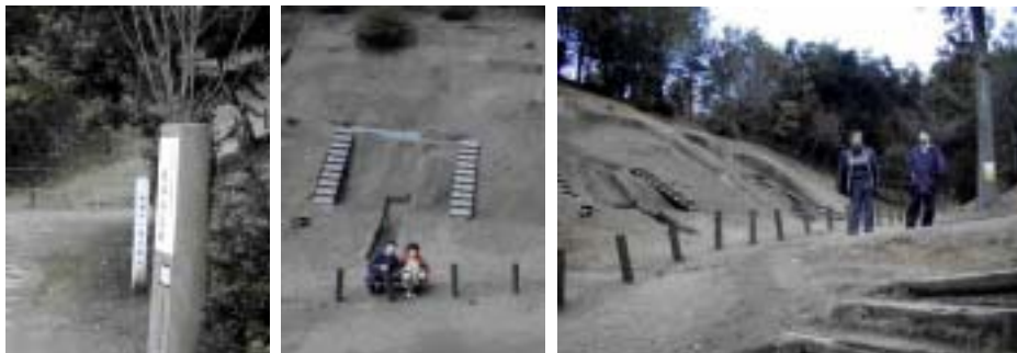
神庭荒神谷遺跡で 2001. 2. 12.

今も発見された時と同じようにレプリカが置かれまじかに発見された様子が見られるとともに、周辺の丘には遊歩道が整備され 青銅器が埋められた山腹全体が眺められるようになっています。