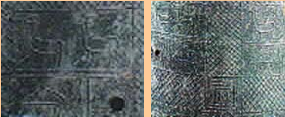
加茂岩倉遺跡で発見された銅鐸の中 幾つかの出雲特有の紋様