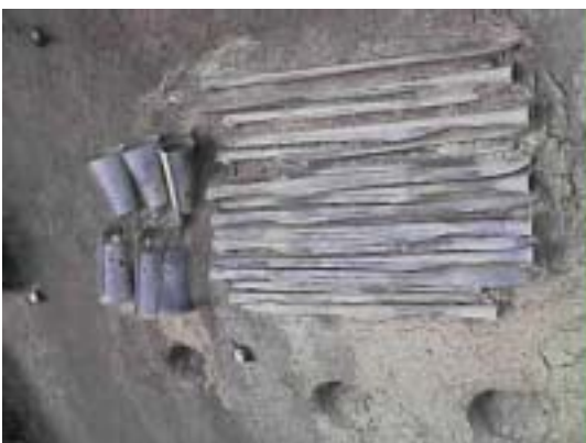
発見された銅鐸・銅

左の写真は発見された銅剣の状態を示していますが、手前から一列に34本、111本、120本、93本の銅剣が、整然と並び、刃を起こして密着した状態で出土しました。日本全国の総出土数を上回る358本もの大量出土は、出雲に巨大な勢力が存在していたことを裏付ける証であり、古代史や考古学界に大きな波紋を投げかけた。これらの銅剣は弥生時代後期（2世紀）「中細形銅剣」類（あるいは「出雲型銅剣」）と呼ばれ、朝鮮半島産の鉛を使っているものが1本残り357本は中国産の鉛を使っていることが分かりました。