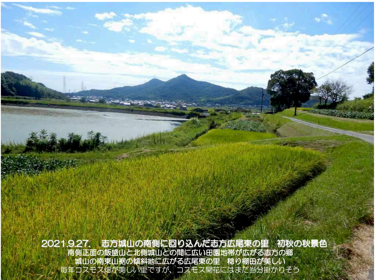
2021.9.27. 志方城山の南側に回り込んだ志方広尾東の里 初秋の秋景色 南側正面の飯盛山と北側城山との間に広い田園地帯が広がる志方の郷 城山の南東山裾の傾斜地に広がる広尾東の里 稔り棚田が美しい 毎年コスモス畑が美しい里ですが、コスモス開花にはまだ当分掛かりそう