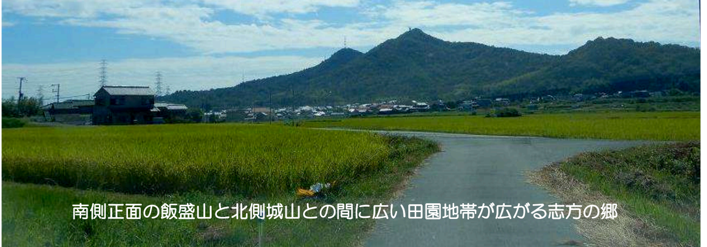
南側正面の飯盛山と北側城山との間に広い田園地帯が広がる志方の郷

快晴の秋の空を眺めながら西神戸の田園地帯を走り抜けて、加古川上荘橋から山間を抜けて、 小野アルプスの山裾 来住野の里へ。 天候にも恵まれ、ゆったりと時が流れる東播磨の田園地帯 ちょっと時期は少し早かったのですが、田園を真っ白にする蕎麦の花。 一目散にJR小野町駅へ。平日の昼時前で、店はゆったり。 久しぶりの蕎麦 おもいきり腹いっぱい食べて、東播磨小野アルプス山麓の田園地帯の秋を楽しみました。 黄金色の田とコスモス畑が田園をピンクに染める毎年訪れる時期には少し早かったのですが、 まだ夏が残る秋景色。真っ青の秋晴れの天候にも恵まれて、 うれしい東播磨加古川東岸初秋の風物詩そば畑を訪ねるWalkになりました。 2021.9.27. Mutsu Nakanishi