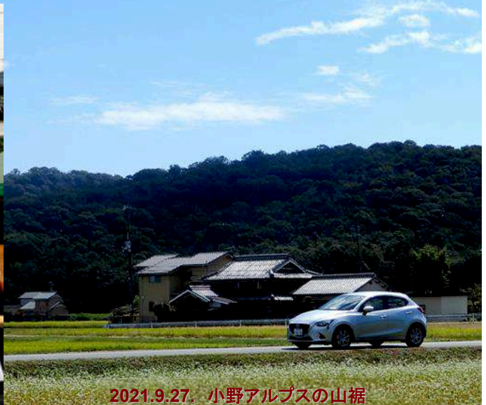
2021.9.27. 小野アルプスの山裾 蕎麦の花が咲き始めた小野市来住野の里