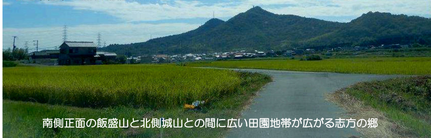
南側正面の飯盛山と北側城山との間に広い田園地帯が広がる志方の郷