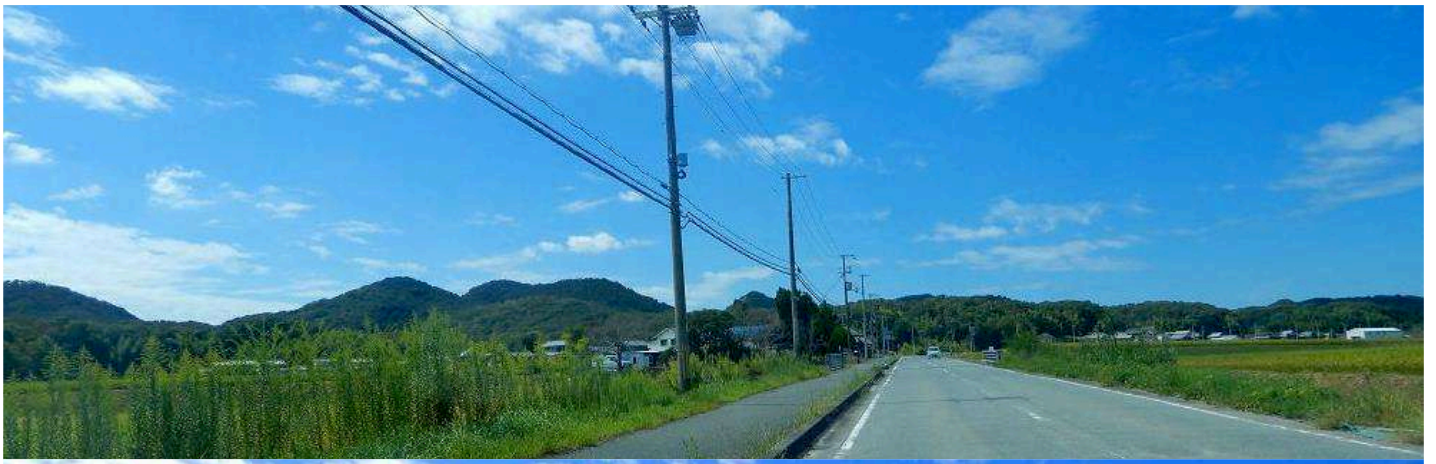
小野アルプス紅山山裾 蕎麦の花が咲き始めた小野市来住野の里