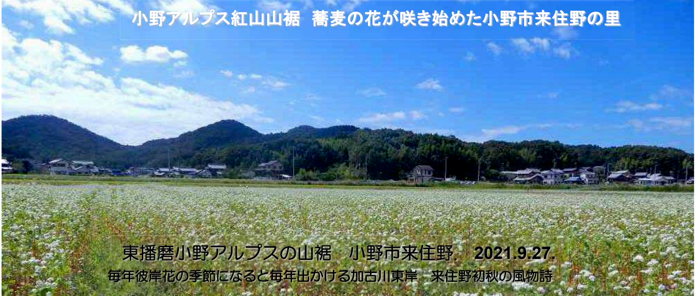
東播磨小野アルプスの山裾 小野市来住野 2021.9.27. 毎年彼岸花の季節になると毎年出かける加古川東岸 来住野初秋の風物詩