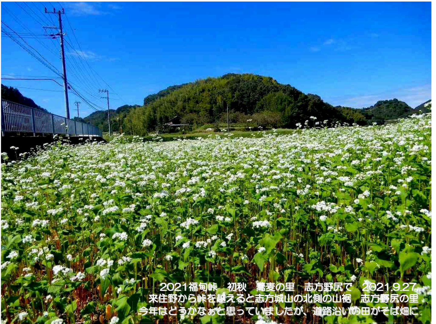
2021福旬峠 初秋 蕎麦の里 志方野尻で 2021.9.27 来住野から峠を越えると志方城山の北側の山裾 志方野尻の里 今年はどうかなあと思っていましたが、道路沿いの田がそば畑に