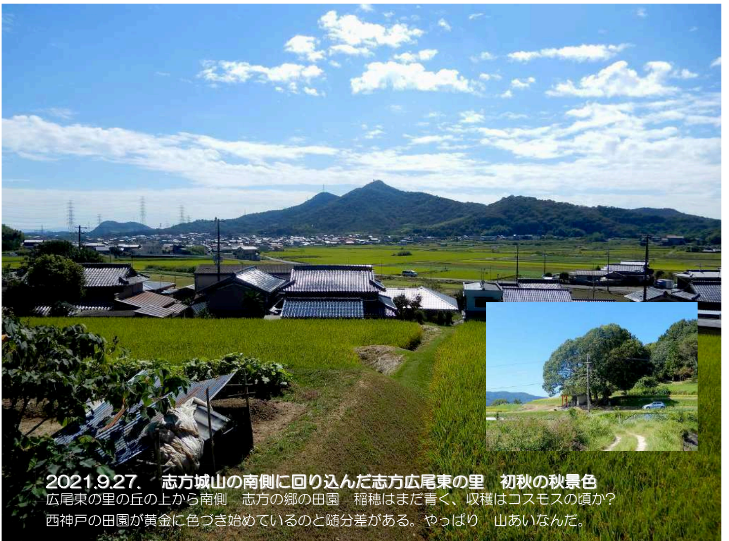
2021.9.27. 志方城山の南側に回り込んだ志方広尾東の里 初秋の秋景色 広尾東の里の丘の上から南側 志方の郷の田園 稲穂はまだ青く、収穫はコスモスの頃か？ 西神戸の田園が黄金に色づき始めているのと随分差がある。やっぱり 山あいなんだ。