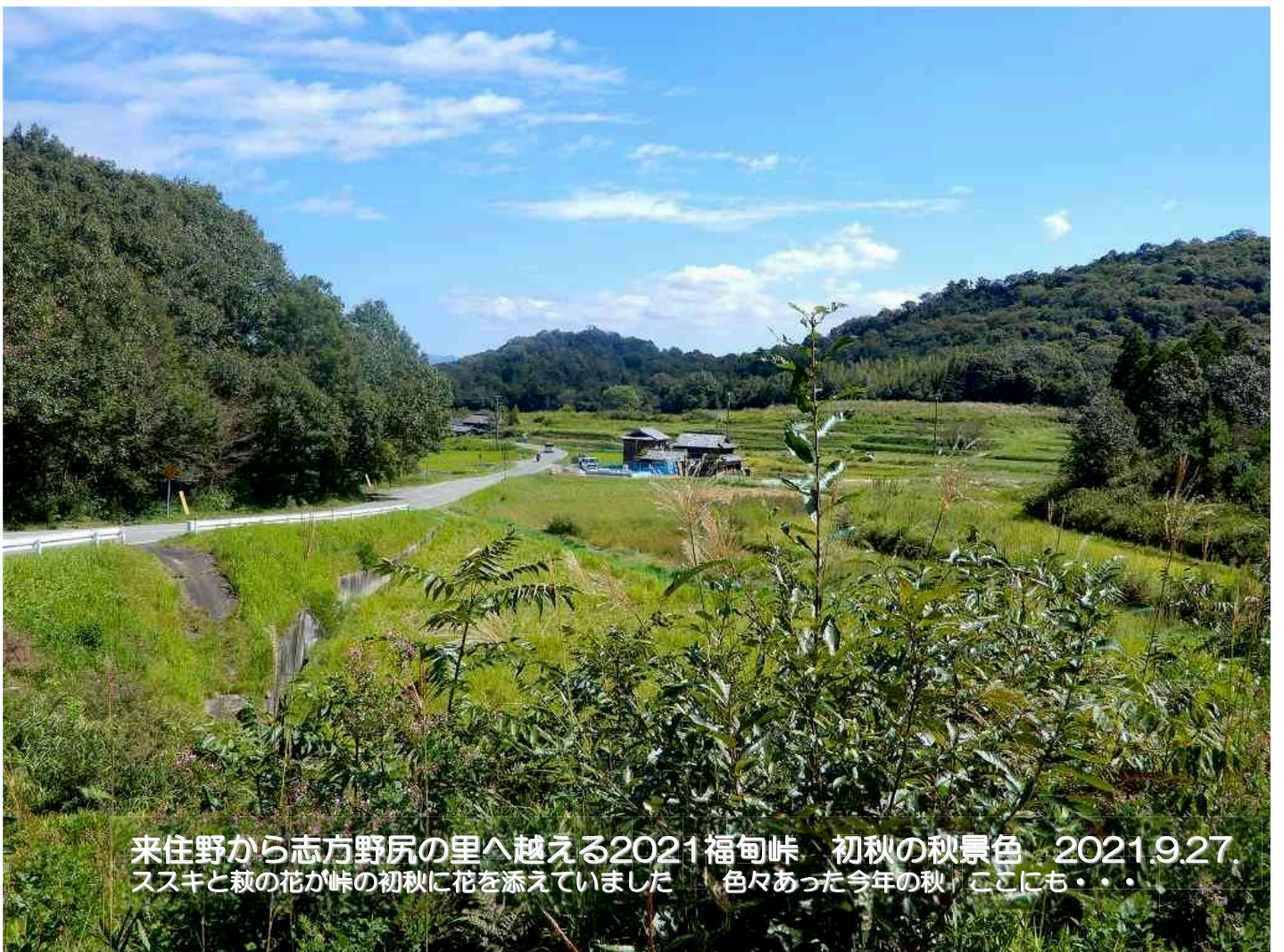
来住野から志方野尻の里へ越える2021福旬峠 初秋の秋景色 2021.9.27. ススキと萩の花が峠の初秋に花を添えていました 色々あった今年の秋、ここにも・・・