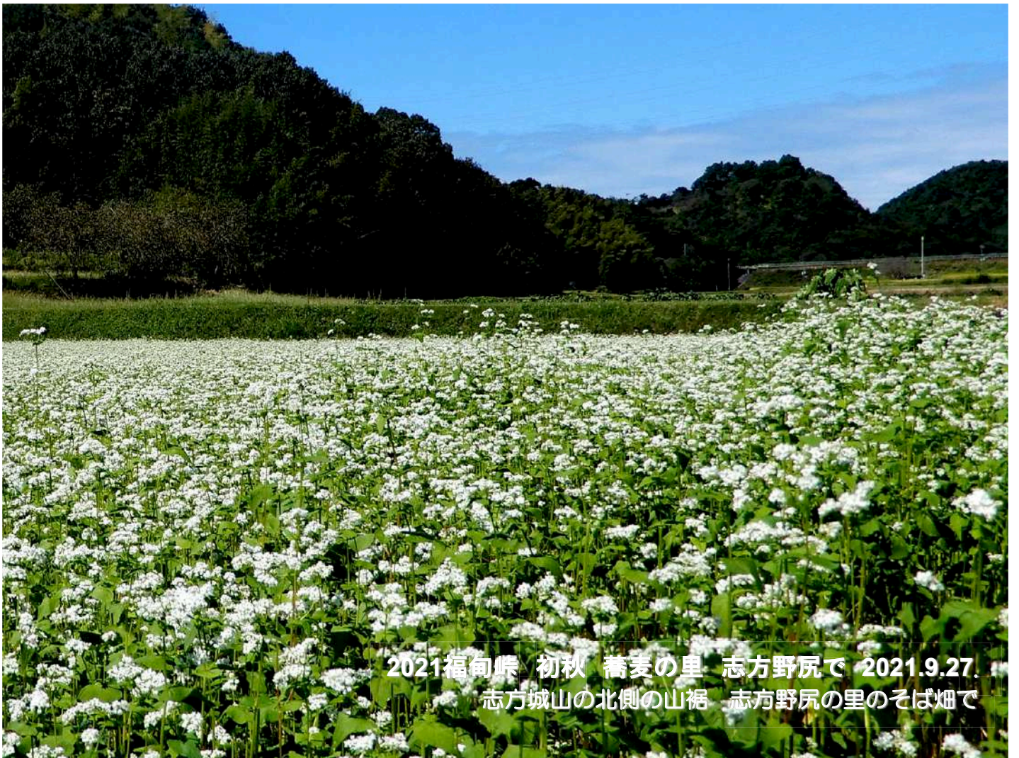
2021福匁県 初秋 蕎麦の里 志方野尻で 2021.9.27. 志方城山の北側の山裾 志方野尻の里のそば畑で