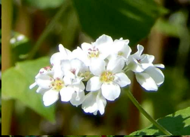
2021福旬峠の初秋 2021.9.27. 志方城山の北側の山裾 志方野尻の里のそば畑で

東播磨の初秋を彩る蕎麦の花 花言葉は懐かしい思い出 Happy Autumn 今を元気に