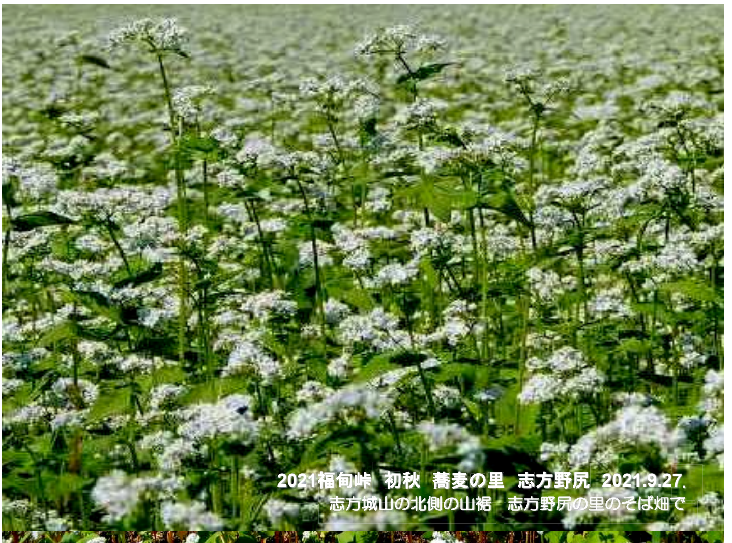
2021福旬峠 初秋 蕎麦の里 志方野尻 2021.9.27 志方城山の北側の山裾 志方野尻の里のそば畑で