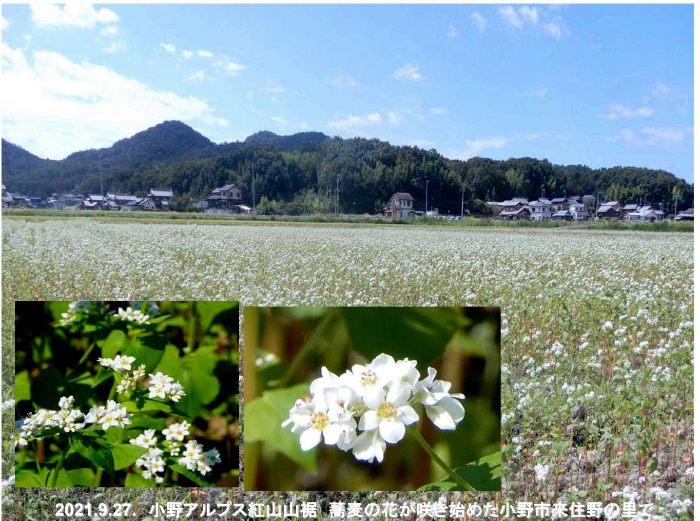
2021.9.27 小野アルプス紅山山裾 蕎麦の花が咲き始めた小野市来住野の里で