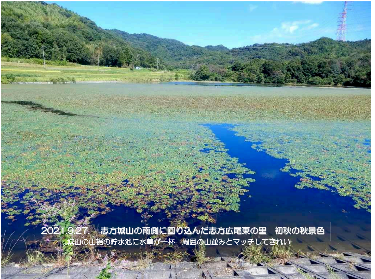
2021.9.27. 志方城山の南側に回り込んだ志方広尾東の里 初秋の秋景色 城山の山裾の貯水池に水草が一杯 周囲の山並みとマッチしてきれい