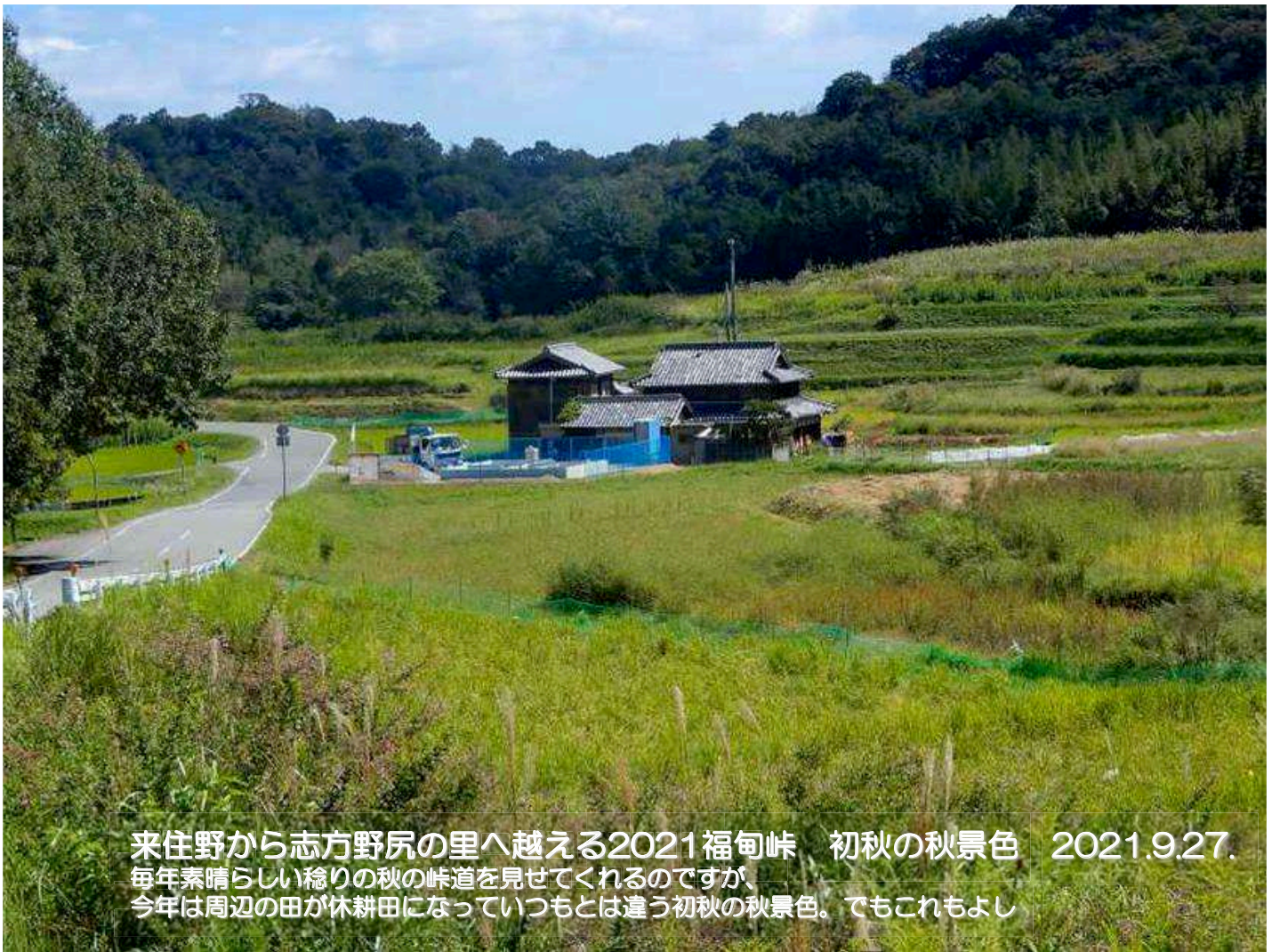
来住野から志方野尻の里へ越える2021福旬峠 初秋の秋景色 2021.9.27. 毎年素晴らしい稔りの秋の峠道を見せてくれるのですが、 今年は周辺の田が休耕田になっていつもとは違う初秋の秋景色。でもこれもよし