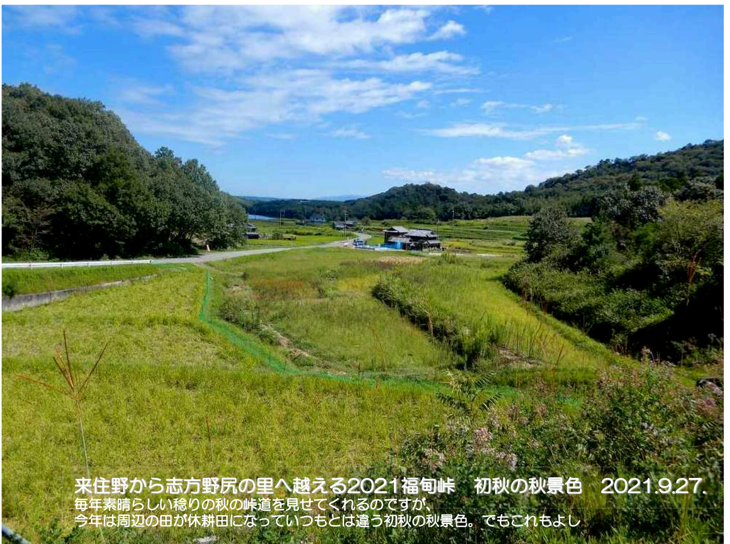
来住野から志方野尻の里へ越える2021福匂峠 初秋の秋景色 2021.9.27. 毎年素晴らしい稔りの秋の峠道を見せてくれるのですが、 今年は周辺の田が休耕田になっていつもとは違う初秋の秋景色。でもこれもよし