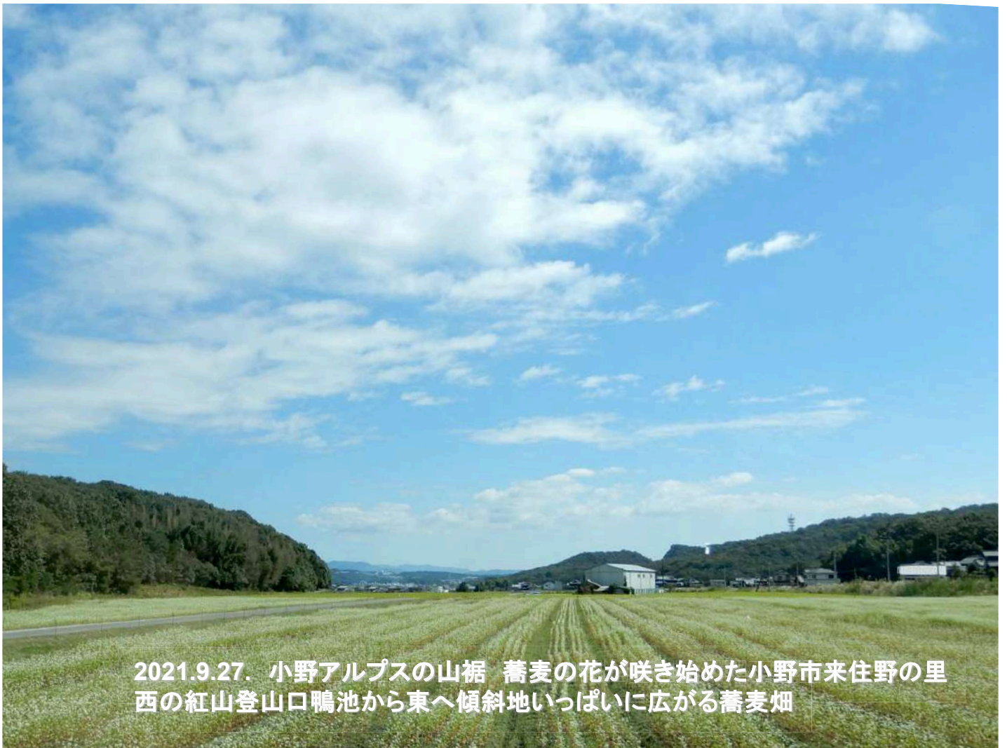
2021.9.27. 小野アルプスの山裾 蕎麦の花が咲き始めた小野市来住野の里 西の紅山登山口鴨池から東へ傾斜地いっぱい広がる蕎麦畑