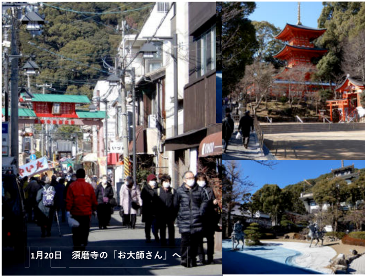
1月20日 須磨寺の「お大師さん」へ