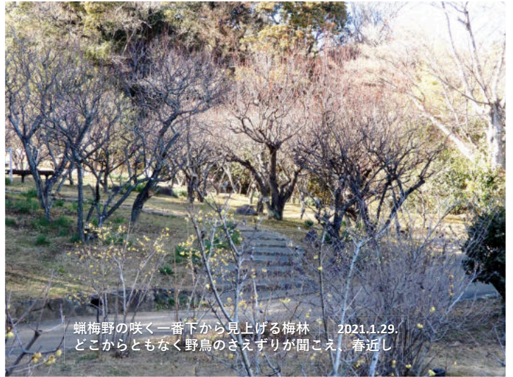
蠟梅野の咲く一番下から見上げる梅林 2021.1.29. どこからともなく野鳥のさえずりが聞こえ、春近し