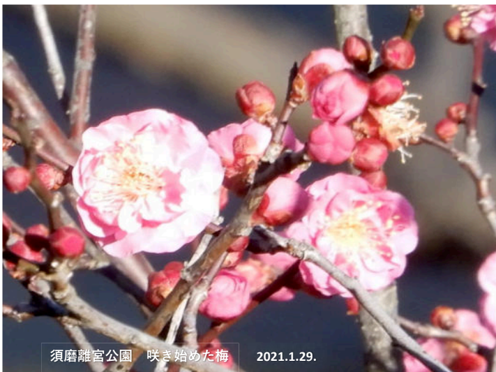
須磨離宮公園 咲き始めた梅 2021.1.29.