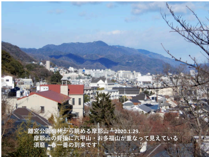
離宮公園梅林から眺める摩耶山—2020.1.29. 摩耶山の背後に六甲山・お多福山が重なって見えている 須磨 春一番の到来です