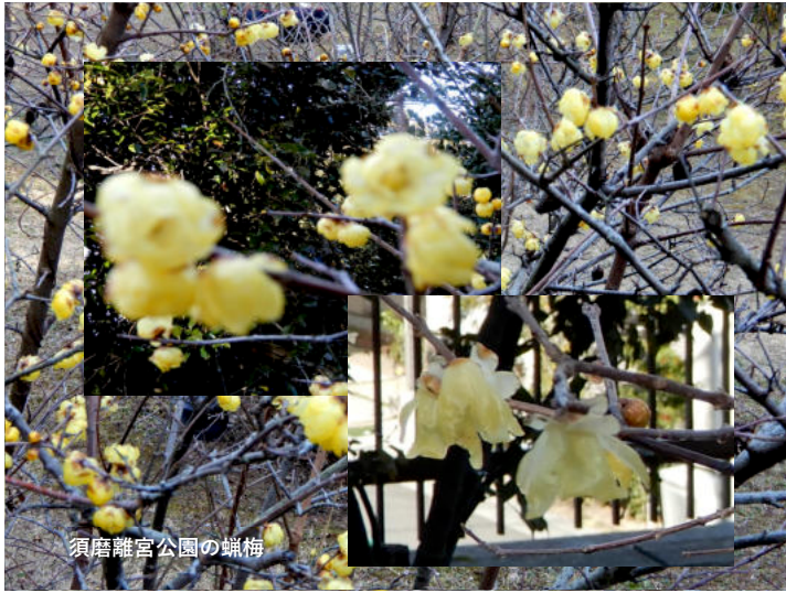
須磨離宮公園の蠟梅