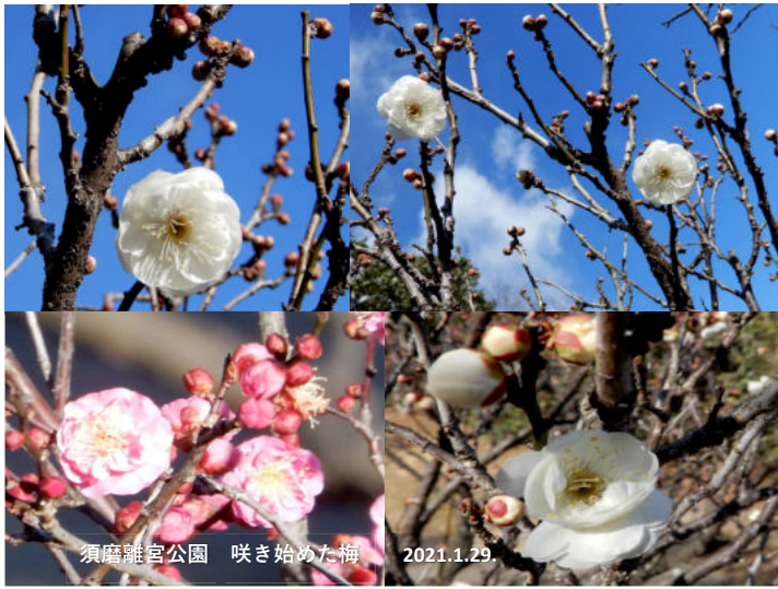
須磨離宮公園 咲き始めた梅 2021.1.29.