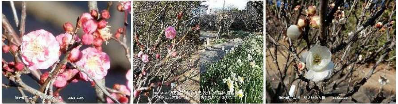
毎日walk 梅の花が咲き始めた須磨離宮公園梅林で 2020. 1. 29.