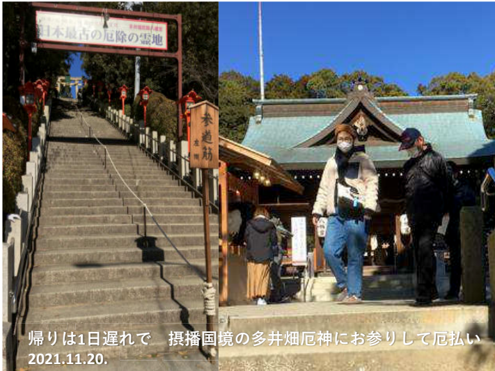
帰りは1日遅れで 摂播国境の多井畑厄神にお参りして厄払い 2021.11.20.