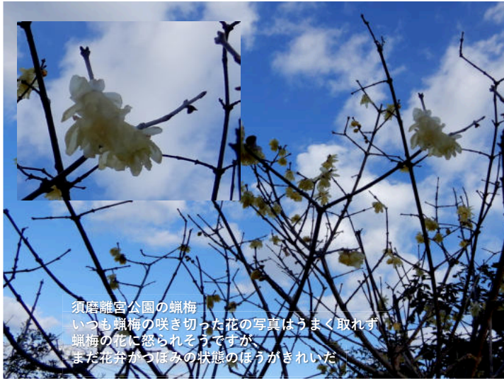
須磨離宮公園の蠟梅 いつも蠟梅の咲き切った花の写真はうまく取れず 蠟梅の花に怒られそうですが、 また花弁がつぼみの状態のほうがきれいだ