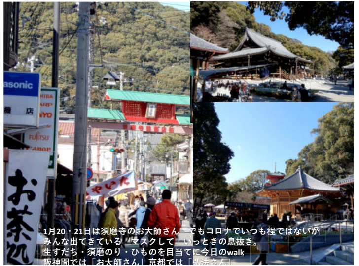
1月20・21日は須磨寺のお大師さん。でもコロナでいつも程ではないがみんな出てきている。マスクして、いつときの息抜き。生すたち・須磨のり・ひものを目当てに今日のwalk。阪神間では「お大師さん」京都では「弘法さん」