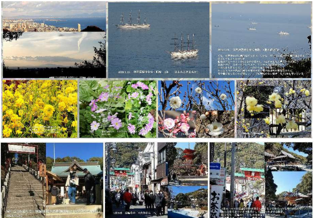
須磨の春迎え 1月19日多井畑厄神 1月20日・21日須磨寺のお大師さん いつもの人出ではありませんが、街に人影 コロナ終息のおねがいもしてほっと一息

コロナ禍 緊急宣言が続く自製の毎日 いかがでしょうか 真っ青な空 西神戸の畑では菜の花がまっ黄色 一気に気分は春モード 庭では 蠟梅・水仙 そしてサクラソウ 姿を見せなかった野鳥も姿を見せ そろそろ梅の花が咲きだしたかなあと離宮公園の梅林へ 須磨寺のお大師さん・多井畑の厄神さんにも マスクながらもお参りの人影 出店の売り声もうれしい ホッと一息 春近し 神戸須磨界限 毎日 walk のひとコマをスライドに