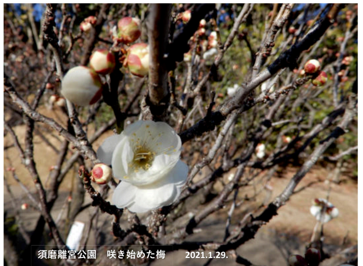
須磨離宮公園 咲き始めた梅 2021.1.29.