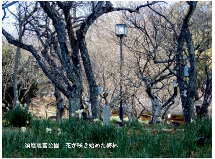
須磨離宮公園 花が咲き始めた梅林