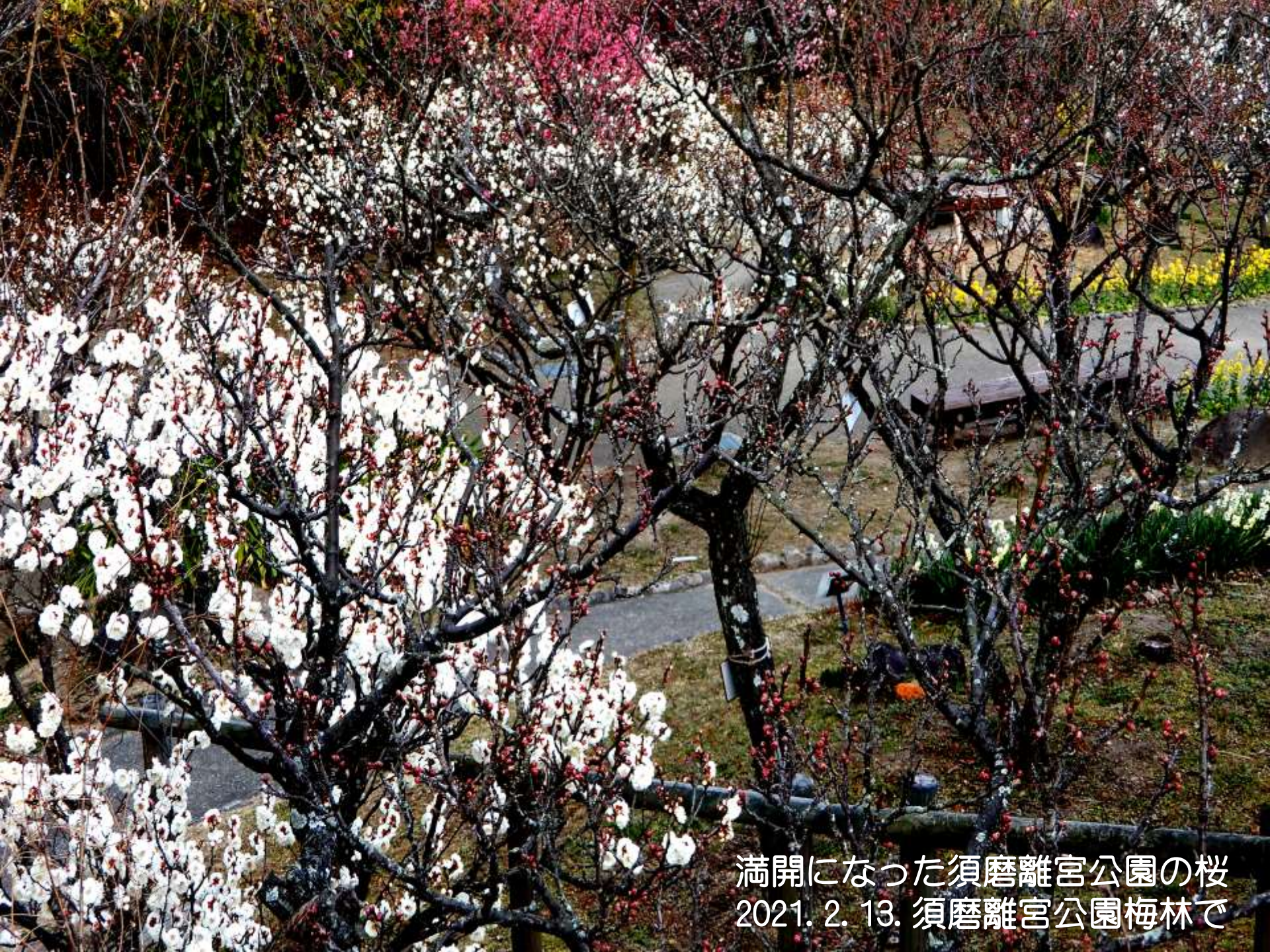
満開になった須磨離宮公園の桜 2021. 2. 13. 須磨離宮公園梅林で