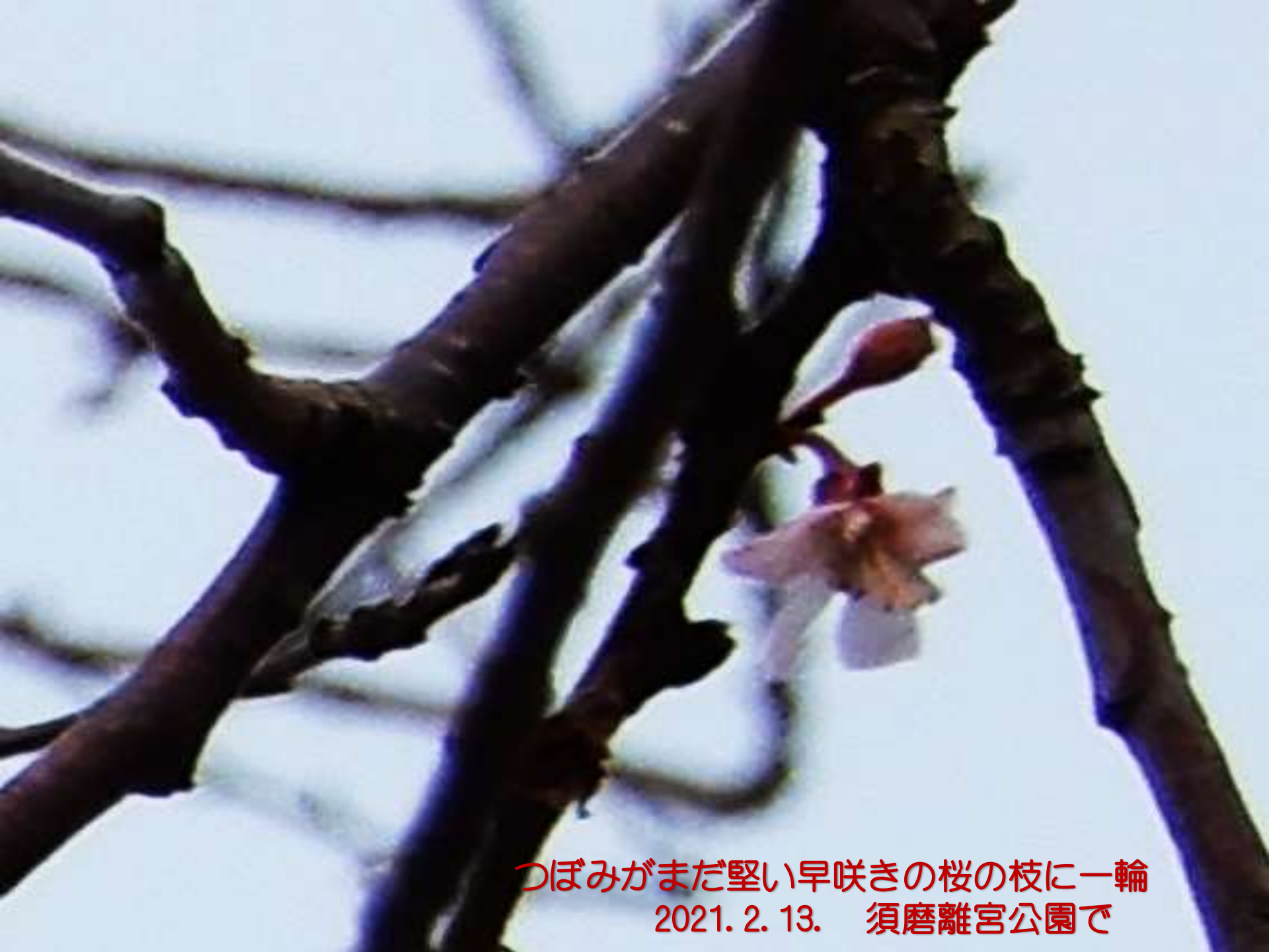
つぼみがまだ堅い早咲きの桜の枝に一輪 2021. 2. 13. 須磨離宮公園で