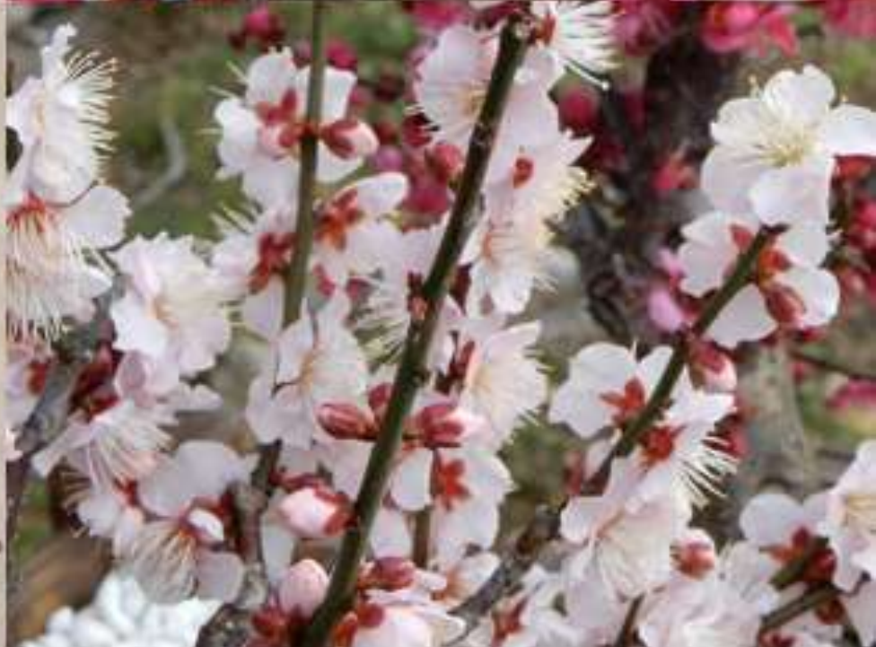
2021. 2. 13. 須磨離宮公園梅林で