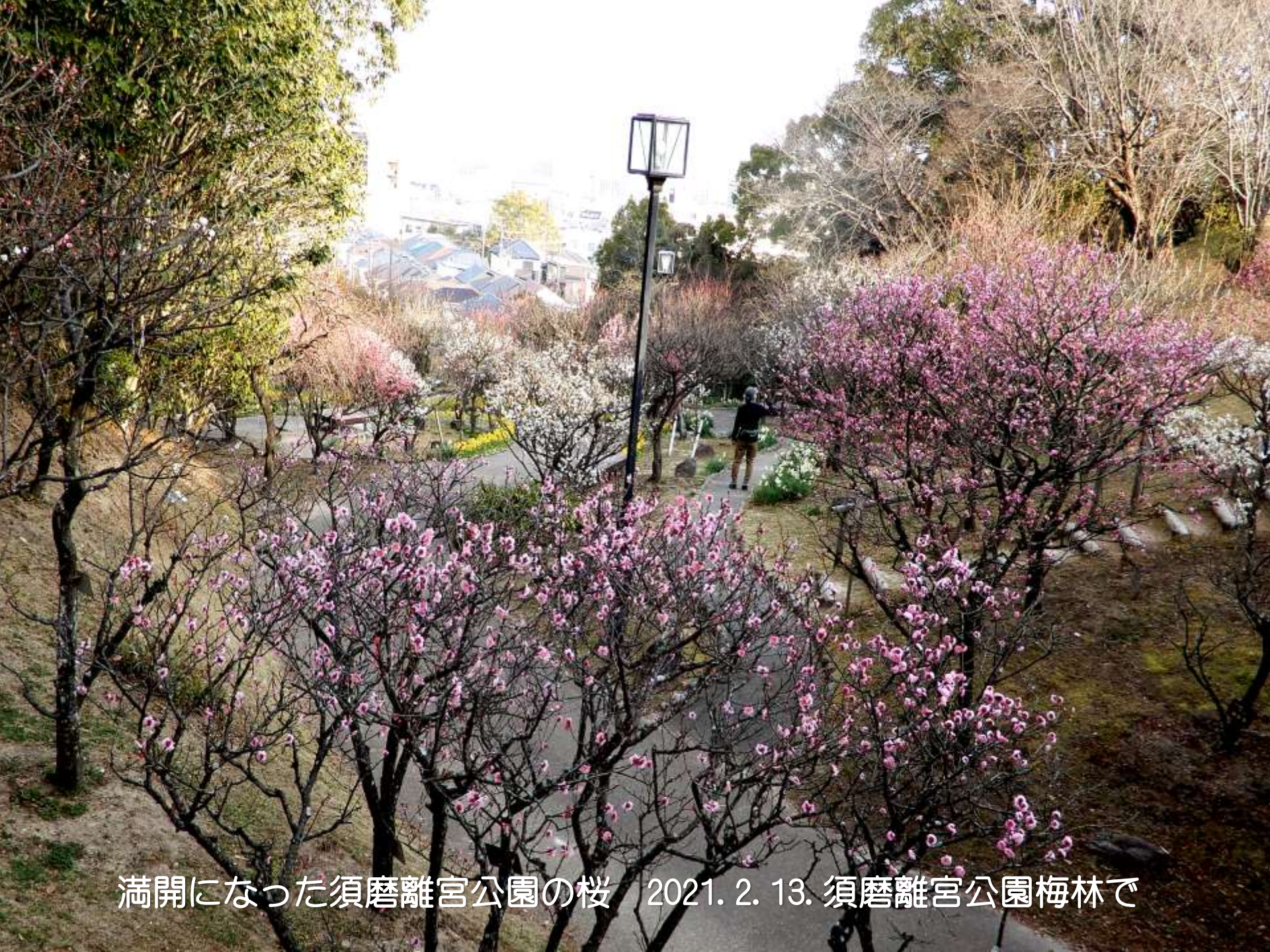
満開になった須磨離宮公園の桜 2021. 2. 13. 須磨離宮公園梅林で