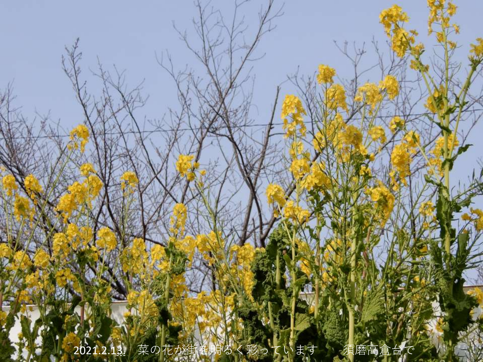
2021.2.13. 菜の花が街を明るく彩っています 須磨高倉台で