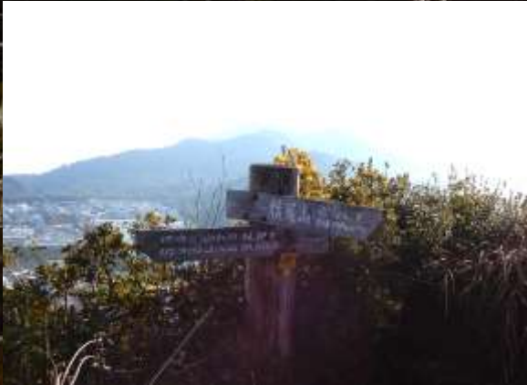
春近し 久し振りに大階段を上って 眺める須磨の海 2021.2.11. 梶尾山山頂 明石海峡に落ちる西六甲縦走路