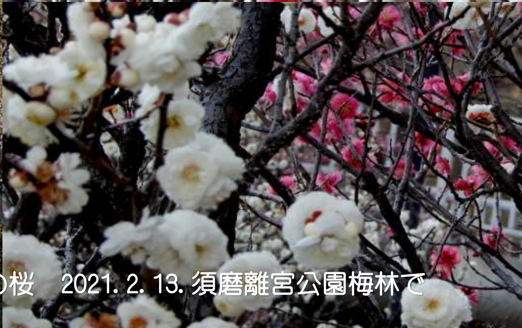
満開になった須磨離宮公園の桜 2021. 2. 13. 須磨離宮公園梅林で