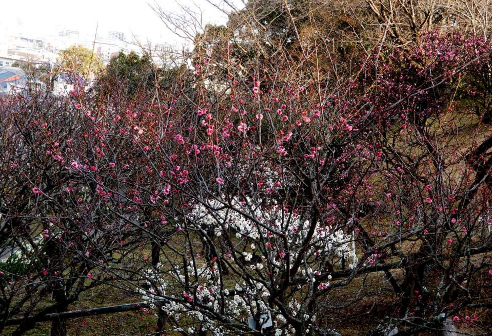
満開になった須磨離宮公園の桜 2021. 2. 13. 須磨離宮公園梅林で