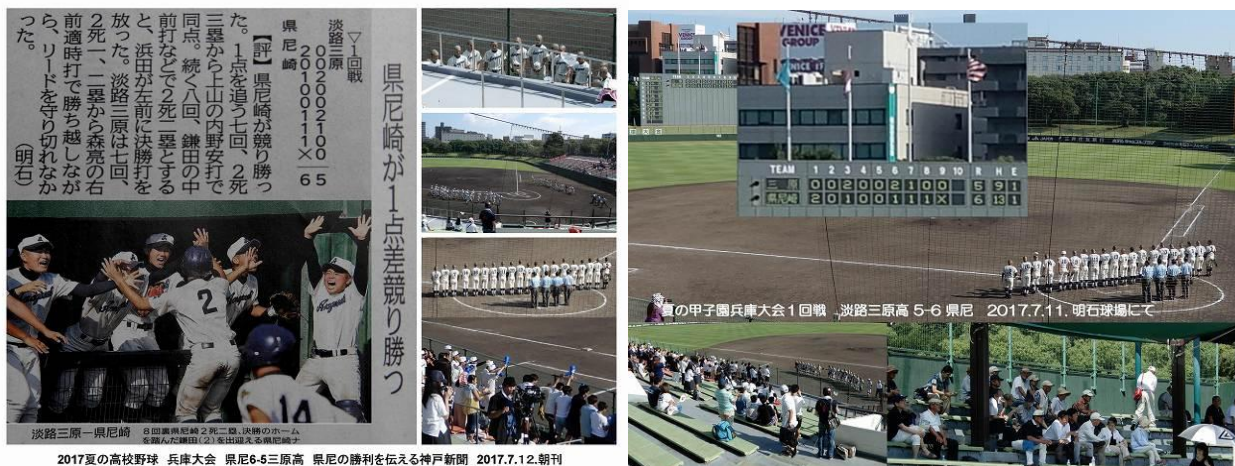
2017夏の高校野球 兵庫大会 県尼6-5三原高 県尼の勝利を伝える神戸新聞 2017.7.12.朝刊