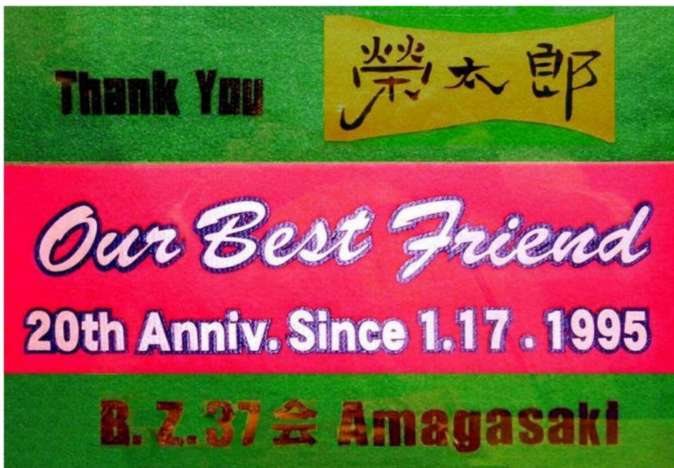
B.Z.県尼37 栄太郎の会 阪神淡路大震災から20周年記念 ペナント 2015.11.22.