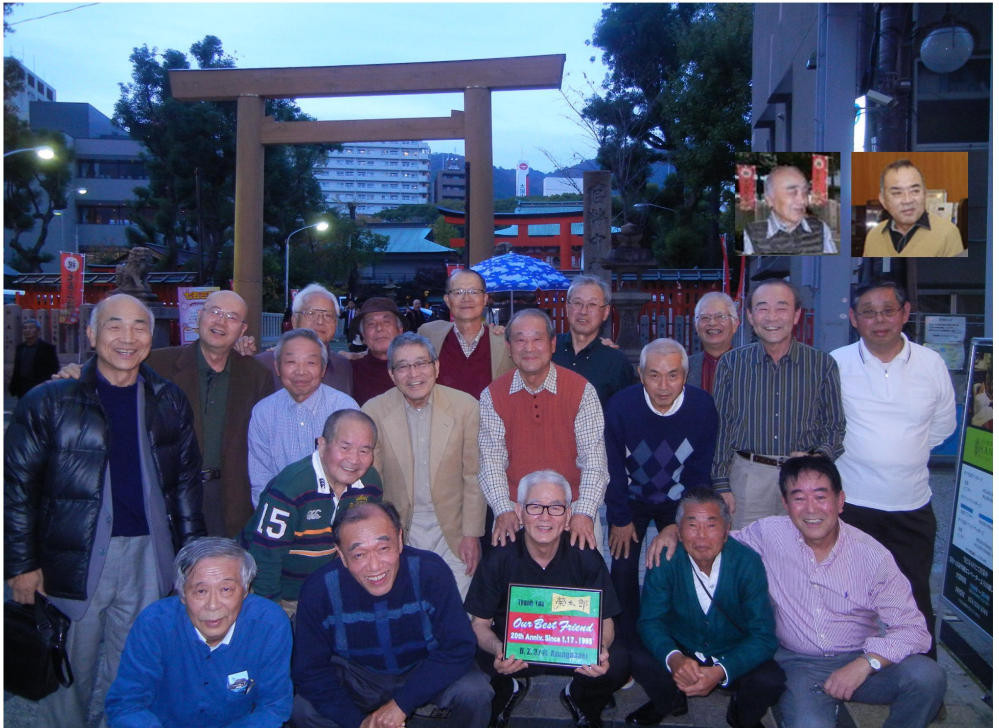
阪神淡路大震災から20周年記念 2015秋 B.Z.県尼37 栄太郎の会 2015.11.22.