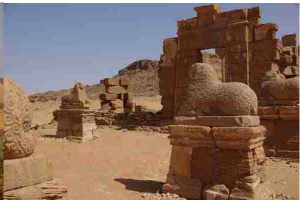
アフリカで初めて製鉄技術を手に入れ、繁栄した黒人王国 古代スーダンのメロエ=クシュ王国(BC6世紀~AD4世紀)

1年半ほど前「何もないスーダンの砂漠の中に ゴロゴロあるんです。 鉄滓と思うのですが・・・」とアフリカ スーダンの考古学研究をしておられる S さんから、拳大の真っ黒なスラグ状塊を見せてもらった。ほぼガラス状で かなり高温で形成された塊。「砂漠の中とは不思議 本当に周囲に遺構がないのか・・・ひょっとして溶岩塊が持ち運ばれたのかなあ????」などと勝手な話をしたことがありました。