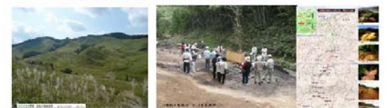
砂鉄採取の残丘が現る砥峰高原 奥出雲 松江道路建設工事でたたら製鉄跡々々

鉄は「文化」をはぐくむとともに数々の「戦さ」を生んだといわれる。それだけ 鉄の力の大きさの証明であり、これからも そうだろうと思いますが、大事なのは それを使う人々の力・心である。「鉄」の持つ魅力 「鉄のまばゆい輝き・閃光」と「鉄の黒光り・肌光」その美しさをこれからも大事にしたいものです。