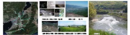
古代大和への鉄の道 澁川・木津川 大和川 紀ノ川

製鉄炉は生産された鉄塊の取り出しの度に壊されるので 製鉄関連遺跡に残っている遺構はそんな生産設備の残骸でも、製鉄関連遺跡には、そんな残骸・生産の痕跡とともに、それに携わった人々の賑わいや数々のドラマが、周りの美しい景色とともにうもれて残っています。