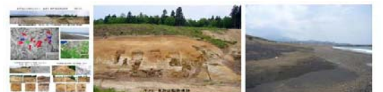
古代 短尾の大製鉄コンビナート 柘崎 鞋井川南製鉄遺跡群

そんな日本で繰り広げられたドラマ そして その痕跡の風景を少しでも残しておきたいと「和鉄の道・Iron Road」として日本各地を Country Walk しつつ集めています。