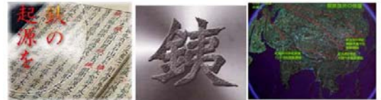
(慶応大学「中国西南地域の鉄から古代東アジアの歴史を語る」シンポジウムより)

「鉄は国家なり」「鉄は産業の米」と「鉄」の力が強調されるが、一方で文化を育み、そこに住む人たちの生活を豊かにし、現在に至る日本を作ってきた。そんな今、急速な社会変革の中で この製鉄にともなう数々のドラマが忘れ去られ、日本各地の「たたら製鉄」遺跡もろとも消え去ろうとしている。