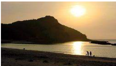
夕日に浮かんだ笠ヶ鼻東側の百済浦。海岸近くにたたら場があった時代には、砂鉄や木炭を運んだり、出来上がった鉄を各地へ送ったりする船が行き来した＝大田市鳥井町鳥井

http://www.sanin-chuo.co.jp/shashin/modules/news/article.php?storyid=553097274