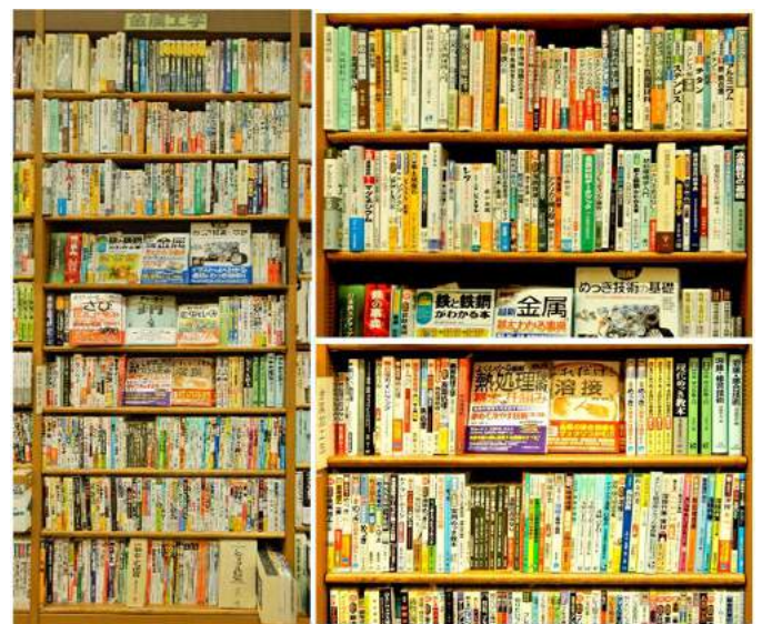
神戸三宮の本屋 理工学書「金属工学」の棚で

地方新聞社出版のふるさと本「山陰中央新報社編「鉄のまほろば -山陰 たたらの里を訪ねて-」 がこの本棚の一角にあったのも、そんな書店の視点でしょうか . . .