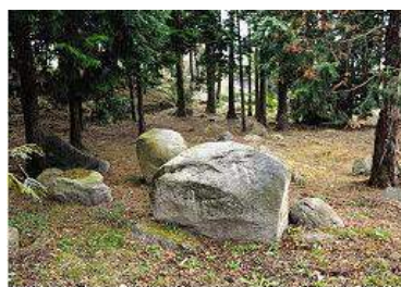
香木の森の裏山に転がる、鉄穴流して出た石＝鳥根県邑南町矢上