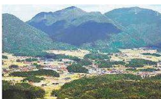
鉄穴残丘が点々とする於保知盆地。鉄穴流しによる地形改変の壮大な営みを感じさせる＝鳥根県邑南町高水の町有宿泊施設「いこいの村しまね」から

http://www.sanin-chuo.co.jp/shashin/modules/news/article.php?storyid=555721274