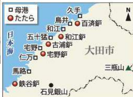
大田市内のたたらと回船業者の母港

大田市の岩見銀山遺跡が世界遺産に登録され、その繁栄ぶりが広く知られている。太田市周辺は江戸後期から明治初期にかけて、久手、鳥井、和江など、大田市内の港を拠点とする回船業者の名が数多く並び、これら、石見の回船業者は『海の総合商社』・鉄と海で栄えた姿が浮かび上がってきた