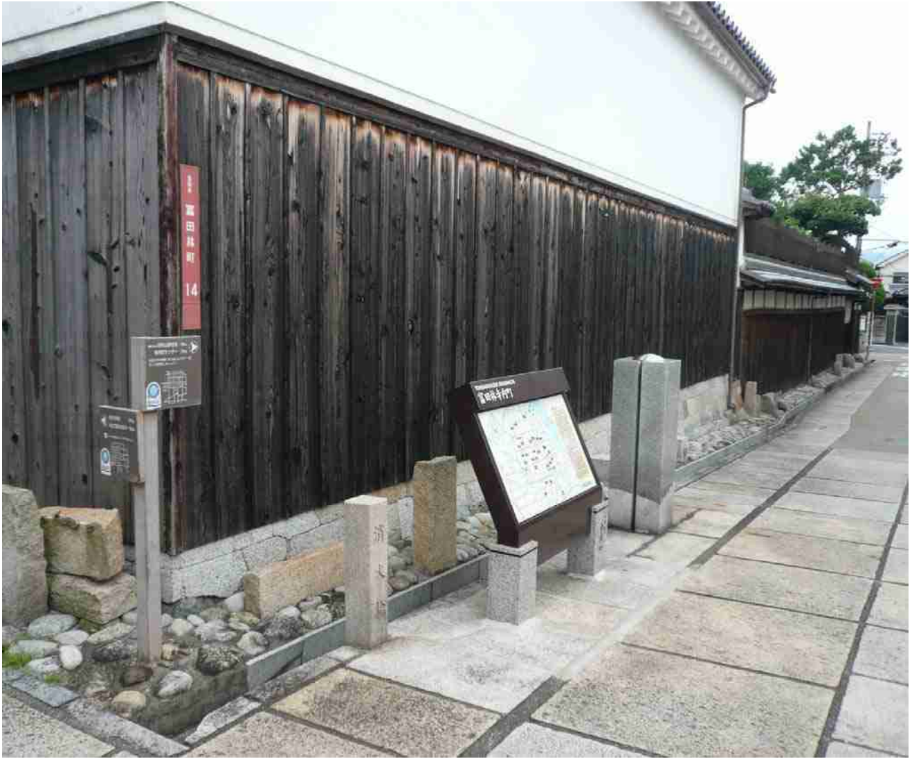
寺内町 富田林の案内板 & 壁板に「富田林町」の名が見える所在地標識