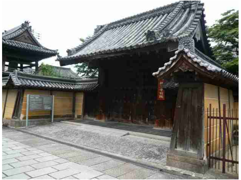
寺内町の中心 興正寺別院 2009.8.15.