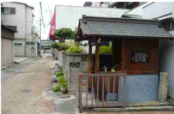
寺内町への北の入口にある地藏