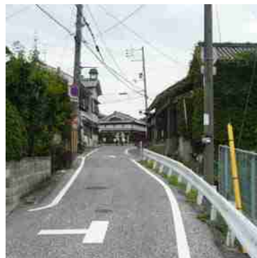
寺内町は段丘のうえにあるので、坂を上って街に入る